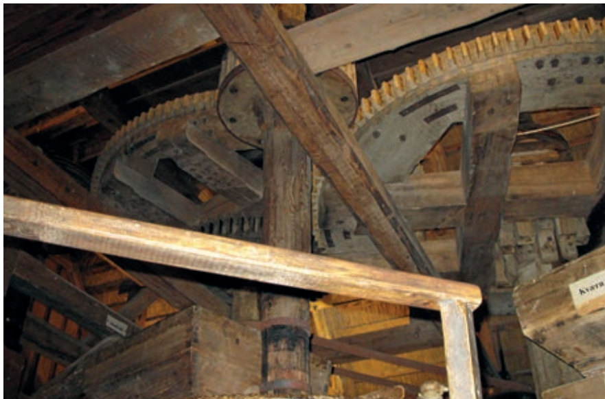
Tand- og kamhjul på Klostermøllen i Vestervig – en farlig arbejdsplads.

Også udenfor var der fare: ved Hesle Mølle druknede en mand i