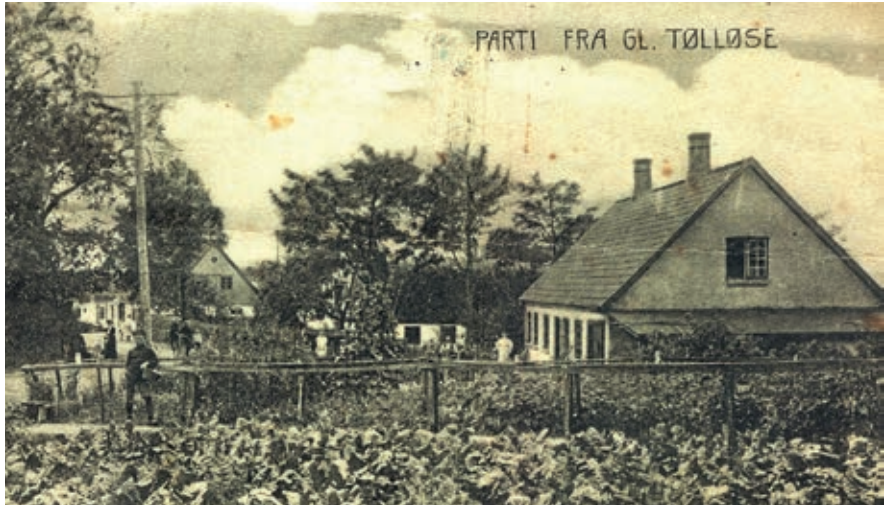
Parti fra Møllegårdsvej i Gl. Tølløse. (Datering: ca. 1900).