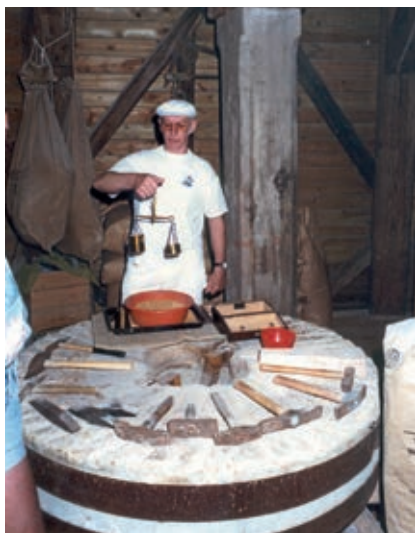
Mølleren på Jernløse Mølle betjener en hollandsk vægt. På møllestenen ligger bildeværktøj til at hugge rillerne i møllestenen med.

indtægt. Der, hvor der var under én mil (7,532 km) til den nærmeste store privilegerede mølle, skulle de små møller nedlægges og kværn-