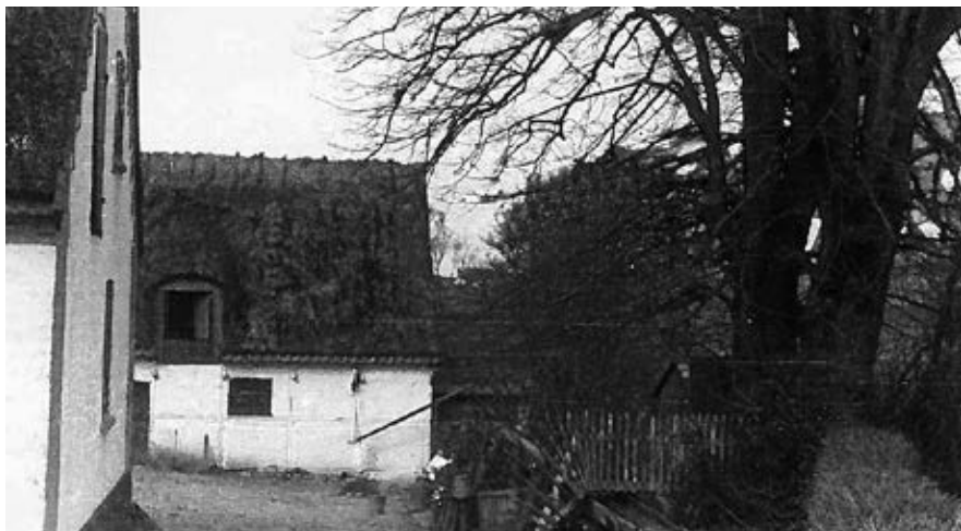
Elverdamsmøllen med møllerhuset i baggrunden t.h. I forgrunden vandslisen, der leder vandet ind i møllen. (Udateret)

I vores område har der udover Elverdamsdalens mange dokumenterede vandmøller (Hesle Mølle,