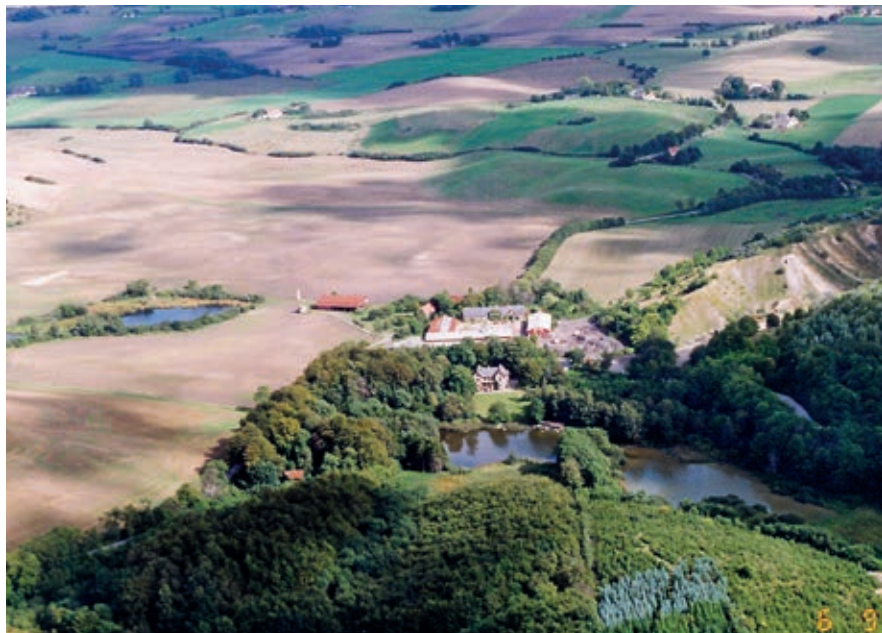
Grøntved Overdrev set fra luften - midt i billedet ligger Sophienholm.