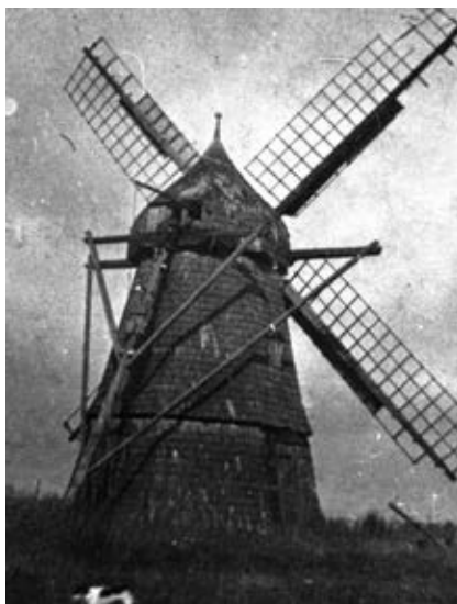
Kr. Eskilstrup Mølle, Sønderstrupvej 157. (Datering: 1909).