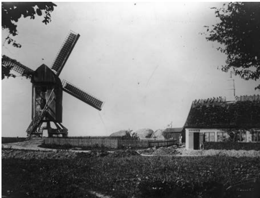
Tolløse Stubmølle, der brændte i 1926. Branden opstod i møllehatten ved persen. (Udateret).

kunne holde mest sejl’, 23 Var persen slidt, ’løb møllen under persen’. 24 Den eneste måde at kunne bremse vingernes drift på, var at kaste en masse korn i kværnen. Lykkedes det ikke at få møllevingerne til at køre langsomme, kunne der gå ild i møllehatten. En anden fare ved hollændermøllen var, at møllehatten blæste helt af i vildt vejr. Den hviler jo blot i sin egen vægt på møllekroppen. Det skete i Herlufllille i 1932. 25 Også stubmøllen var særlig vindfølsom og kunne vælte. I 1895 blev