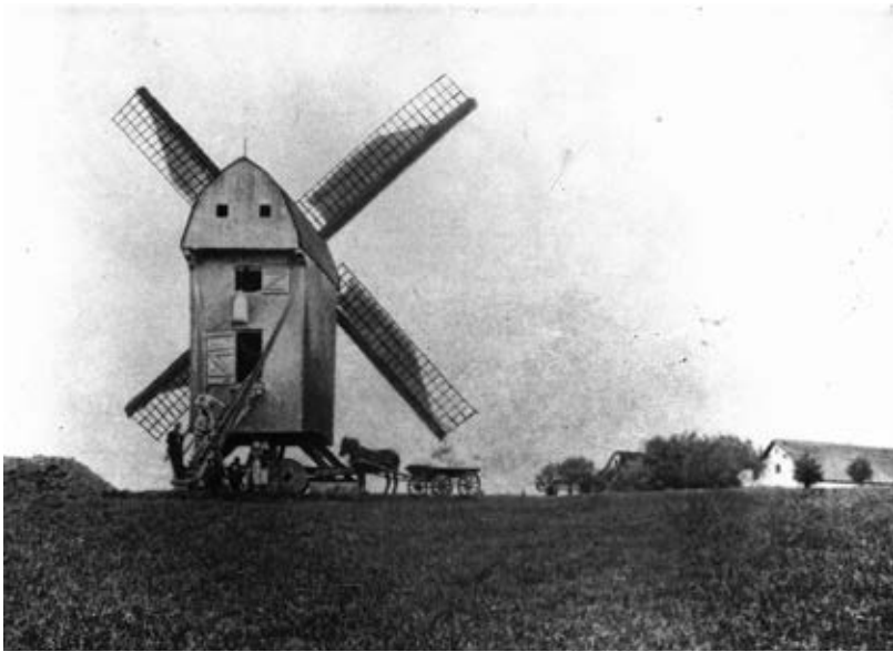
Ubberup Mølle, Hulebækvej 7, Ugerløse. (Udateret).