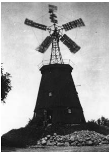
På Merløse Mølle blev hatten og vingerne erstattet af en vindmotor. (Udateret).

Med krigens dyrtid skærpedes fagforeningernes krav. I Klostermøllen i Vestervig kan man læse Overenskomsten af 1916, indgået i Roskilde mellem Dansk Mølleri-