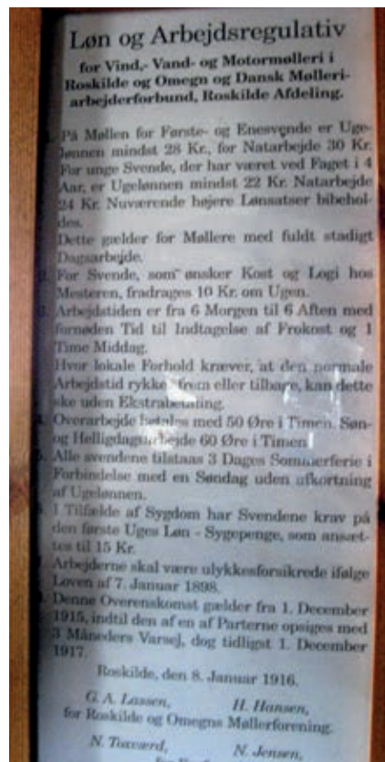
Løn- og arbejdsregulativ, ophængt i Klostermøllen, Vestervig.

På landet var forholdene anderledes: her bestod svendelønnen oprindeligt for en stor del af drikkepenge fra kunderne. Det var ikke nødvendigvis den, der kom først til